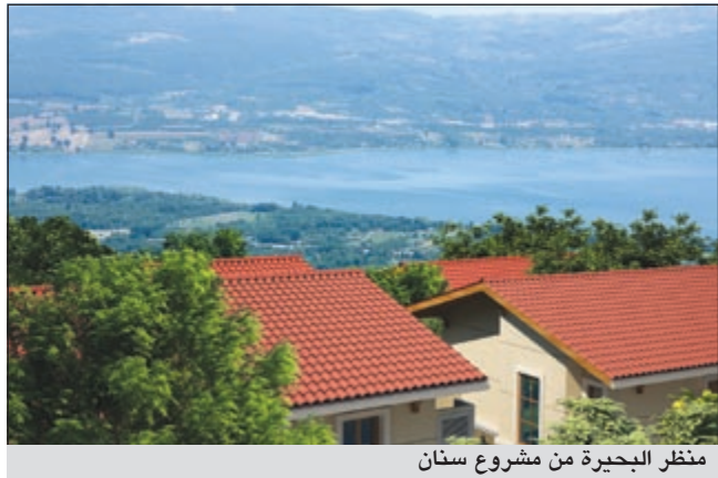
منظر البحيرة من مشروع سنان